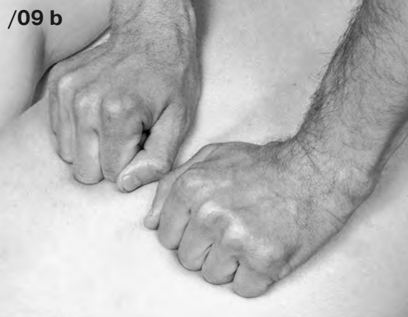
б). Кисть, сжатая в кулак, движется передним ходом, как при исполнении глажения.

а). Поперечное согребательное движение кисти сжатой в кулак с опорой на локтевой край.