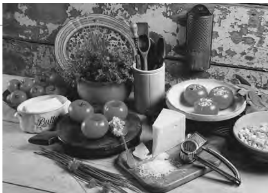
Аккумуляторы 2-го порядка

ши дети будете есть такие продукты регулярно, вы почувствуете, что ваша энергия и я настроение будут повышаться сразу же после принятия пищи. Чем больше