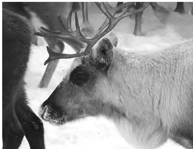
Север без него не живет