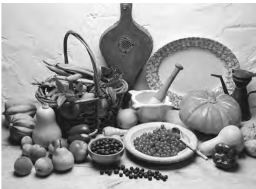
Аккумуляторы 1-го порядка

Продукты высокой питательной ценности, обладающие наибольшей жизненной силой — аккумуляторы 1-го порядка. Содержат в себе структуры с максимальной концентрацией солнечного света: зеленые листья, плоды, овощи, фрукты, корни, орехи, хлеб из проросшего зерна. В эту группу ученый включил и материнское молоко для грудных детей, цельное коровье молоко и сырые яйца. Бирхер-Беннер рекомендовал их для лечебного питания. Если вы и ва-